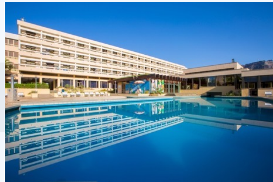
M CLUB LIPARI