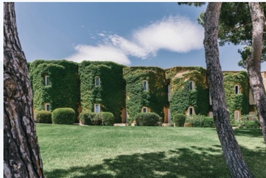
MANGIA'S BRUCOLI RESORT