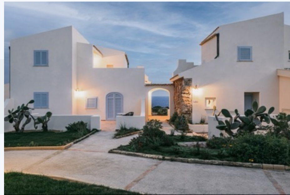
MANGIA'S FAVIGNANA RESORT