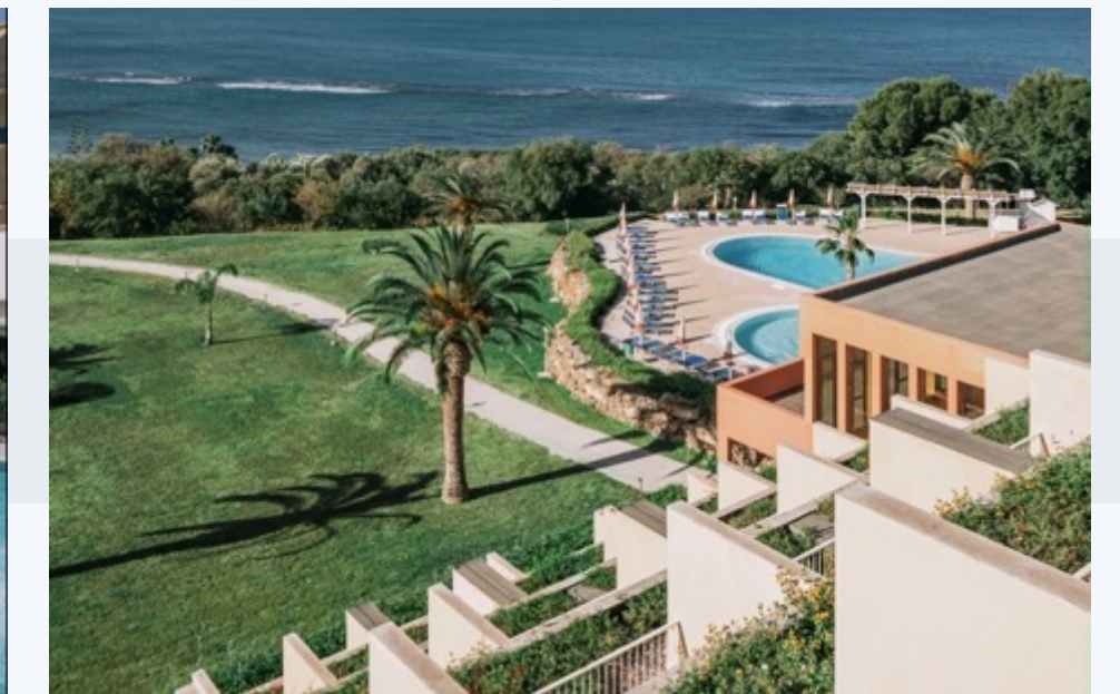
M CLUB CALA REGINA