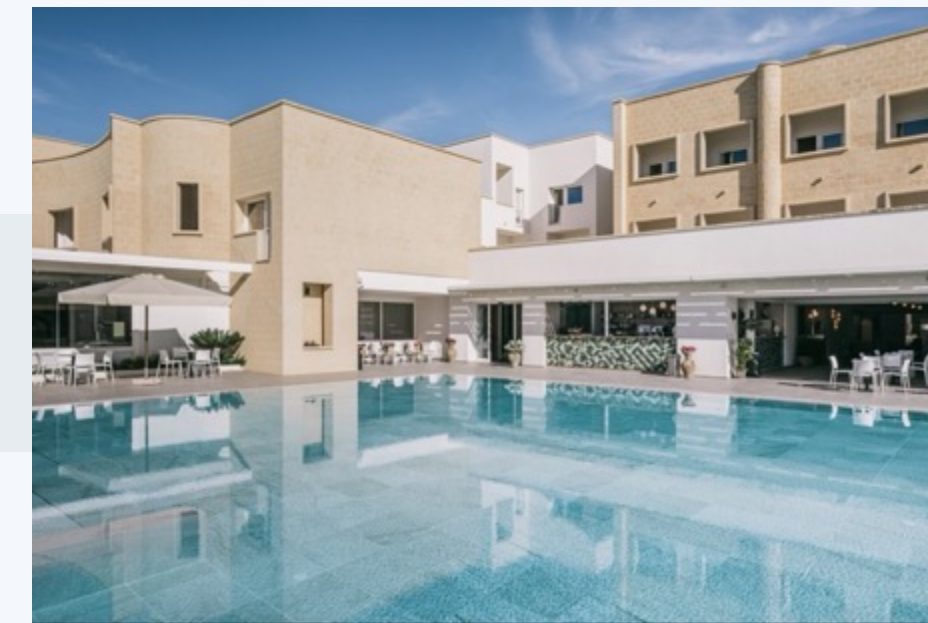
MANGIA'S HIMERA RESORT