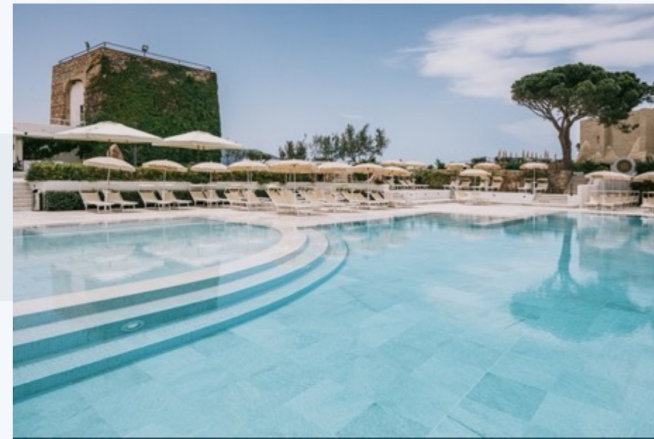
MANGIA'S POLLINA RESORT