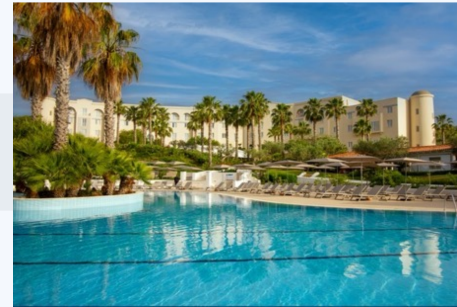
MANGIA'S SELINUNTE RESORT