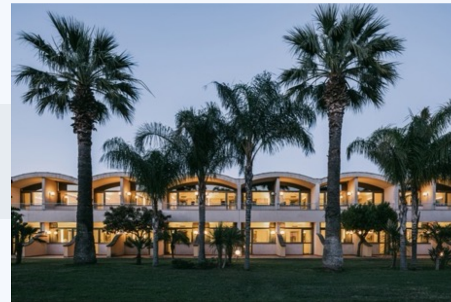
M CLUB ALICUDI