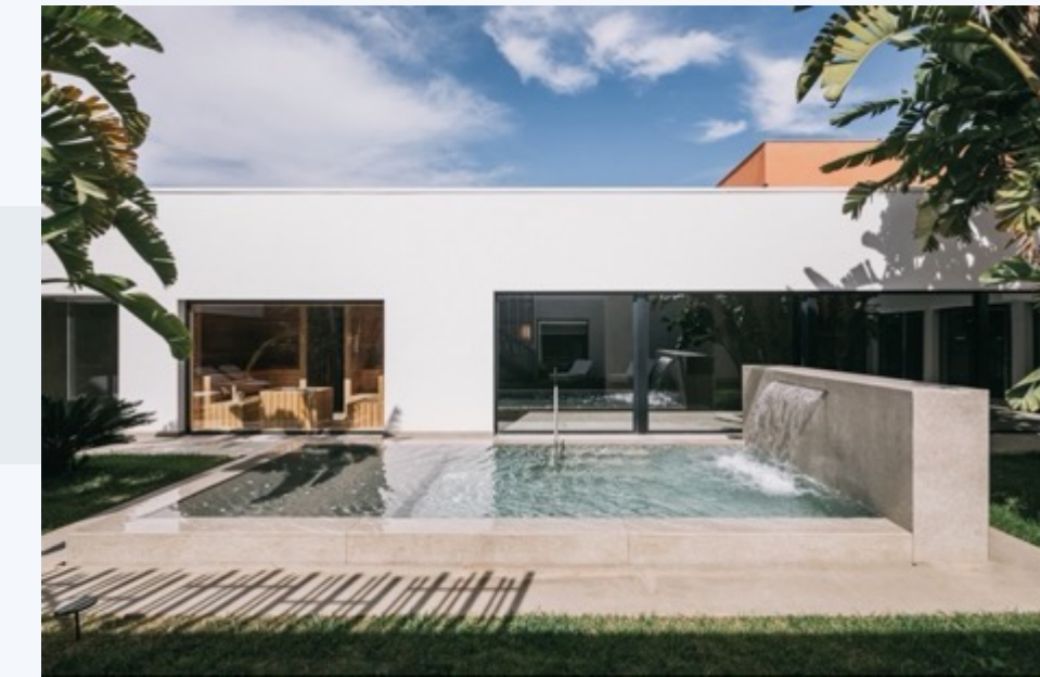
MANGIA'S TORRE DEL BARONE RESORT